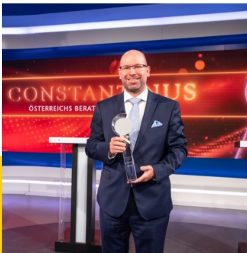
Autor: Jürgen Kaiser

6 Handlungsempfehlungen, damit Sie bei Ihrer nächsten Finanzierungsanfrage an Ihre Bank nicht durch Triage aussortiert werden!